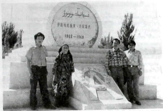
Генерал Ысакбектин Кулжа шаарындагы кумбөзү. 1988-жыл.