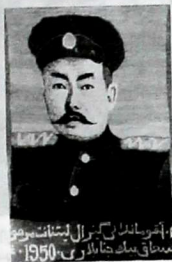
1950-жылы Исхакбай ысакбектин портретинин кыскача сүрөтү.