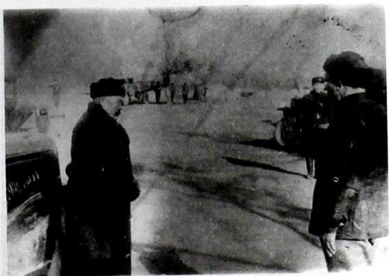
Генерал Ысакбек согуш талаасында. 1947-жыл.