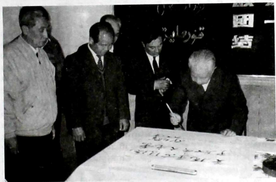
Ысакбектин Кулжа шаарындагы музейинде.