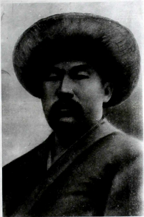
Ысакбектин айылдагы кези.