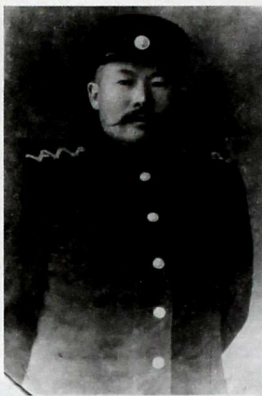
Генерал Кулжада. 1947-жыл.