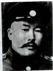
伊斯哈克拜克烈士。