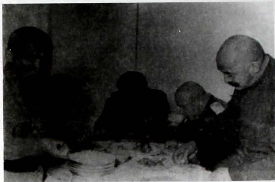
Ысыкатада Кыргызстандын жетекчилери менен түштөнүү учуру.