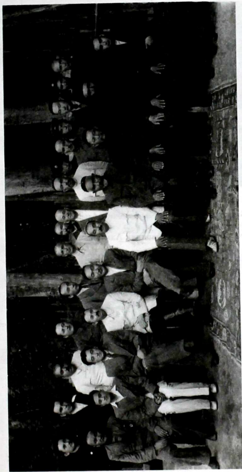
Чыгыш Түркстан Республикасынын жетекчилери. Биринчи катарда солдон алтынчы Ахметжан Касими, солдон бешинчи Далилхан Сугурбаев, солдон үчүнчү Абдыкерим Аббасов. 1945-жыл. Кулжа шаары.