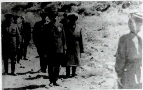
Ысыкатада аскер курап жүргөн мезгил. Биринчи катарда Кыргыз ССР Эл Комиссарлар Советинин төрагасы Төрөбай Кулатов, жанында Ысакбек. 1944-жыл.