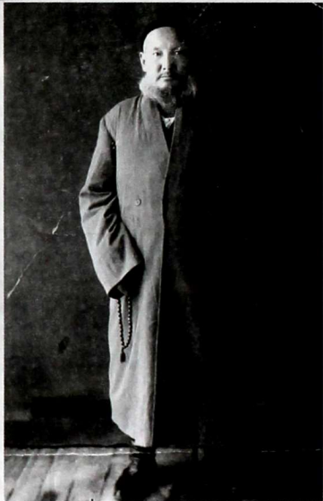
Атасы Мону ажы.